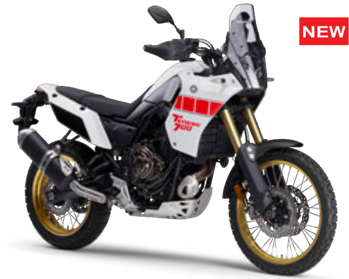
マットダークグレーメタリックA(マットグリーンニッシュグレー)